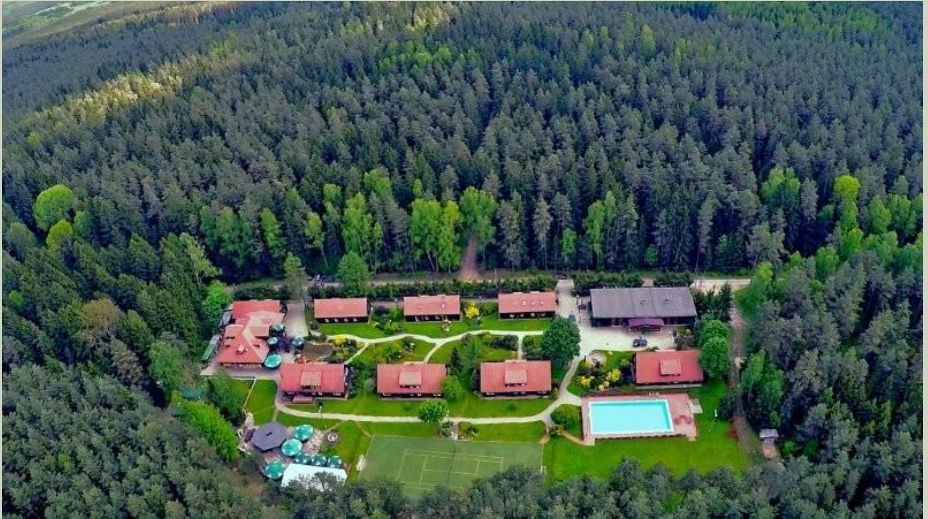
Ośrodek Wypoczynkowy - ROZŁOGI